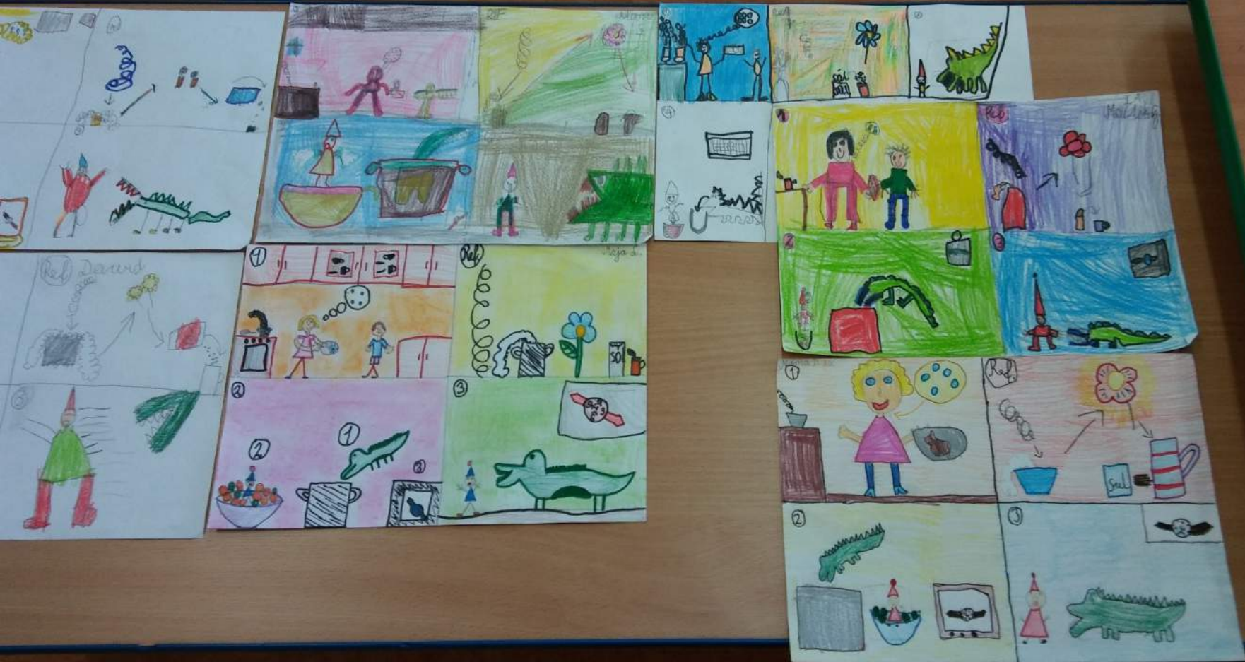
Zilustrowany tekst piosenki samodzielnie przeczytanej.